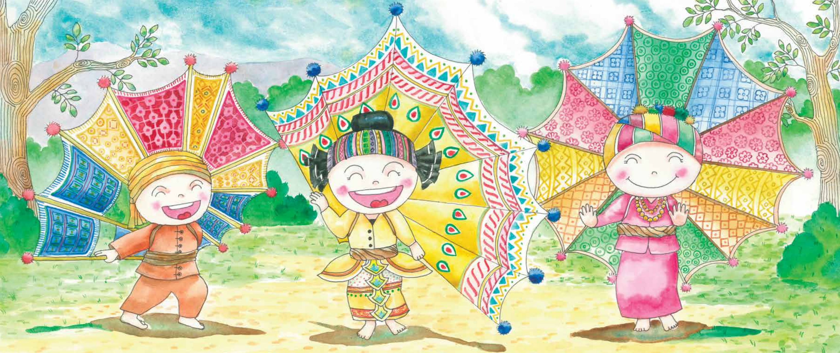
ไทใหญ่รำกิ่งกะหล่ำ โบกปีกเรีงรำ เป็นนกหลากสี