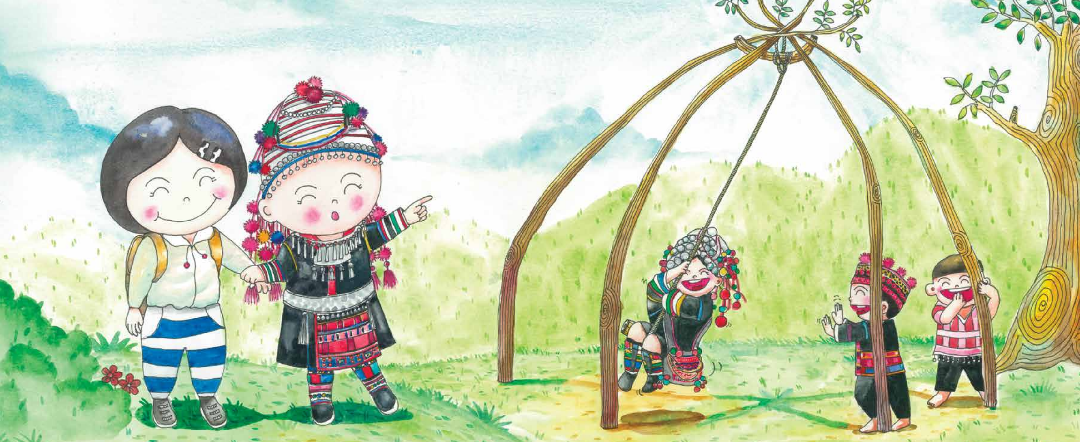
อาช่าชวนไล้ชิงซ่า แกว่งไกวไปมา ซ่ายทีขวาที