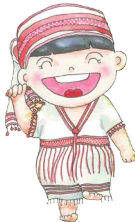
ปวาเกอะญอ