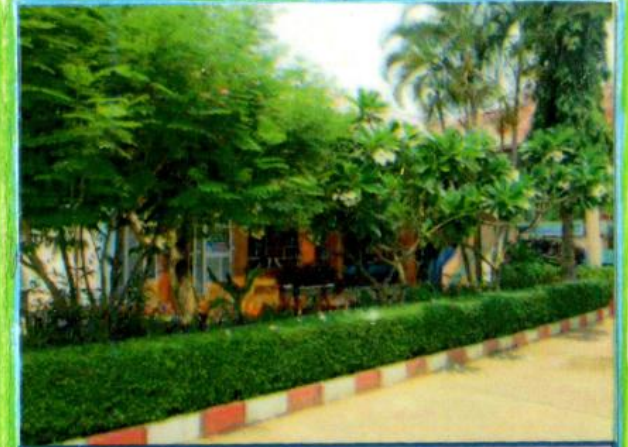
สภาพแวดล้อมโรงพยาบาลส่งเสริมสุขภาพ ต.ยางคำ