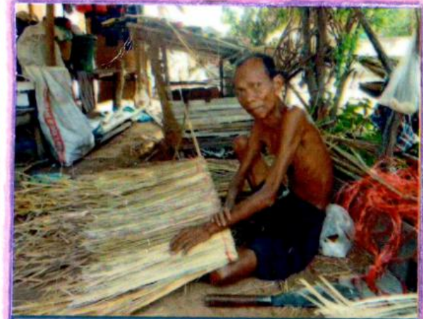
หม้อมุงหลังคาฝีมือ คุณตาเชียว