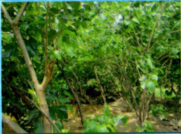
สวนหม่อนของคุณยายอากาศ มูลแวง