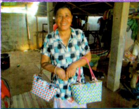
กระเป๋าที่สานจากเส้นพลาสติก