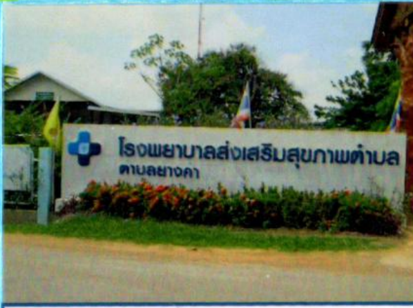
โรงพยาบาลส่งเสริมสุขภาพ ต.ยางคำ