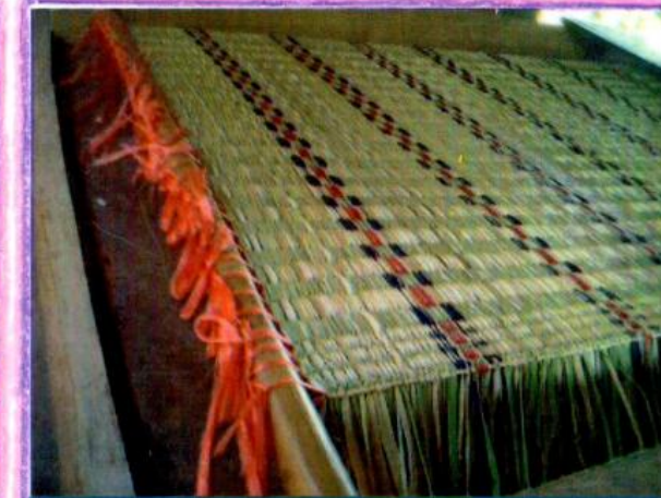
การทอเสื่อจากต้นไผ่