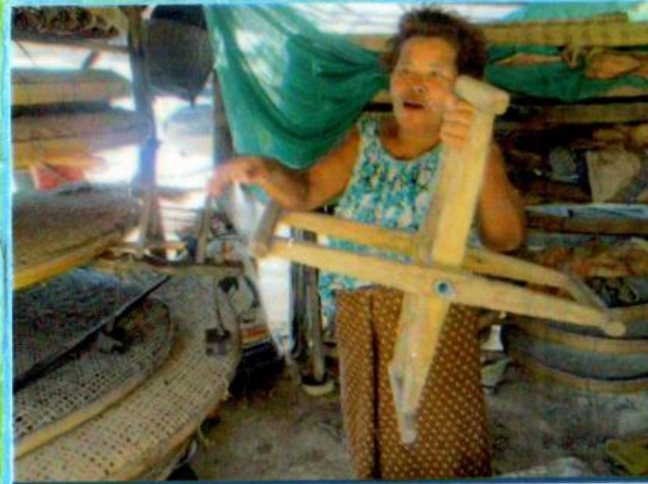
เครื่องมือในการเลี้ยงไหมของคุณยายอากาศ มูลแวง