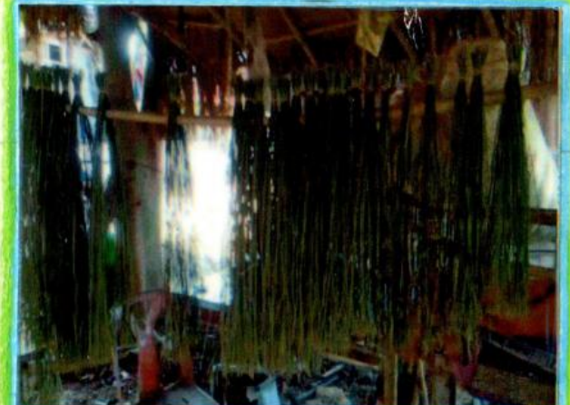
ขั้นตอนการเตรียมต้นไหม บ้านคุณตา คำเบา