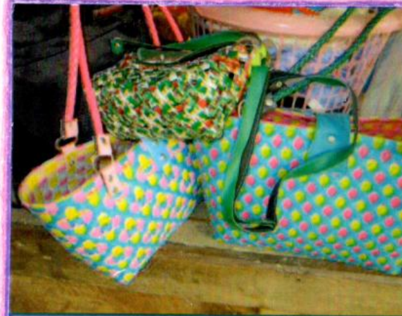
กระเป๋าที่สานจากเส้นพลาสติก