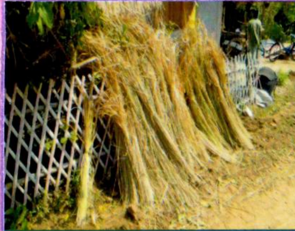
ขั้นตอนการทำหญ้าคาเพื่อทำเป็นหม้อมุงหลังคา