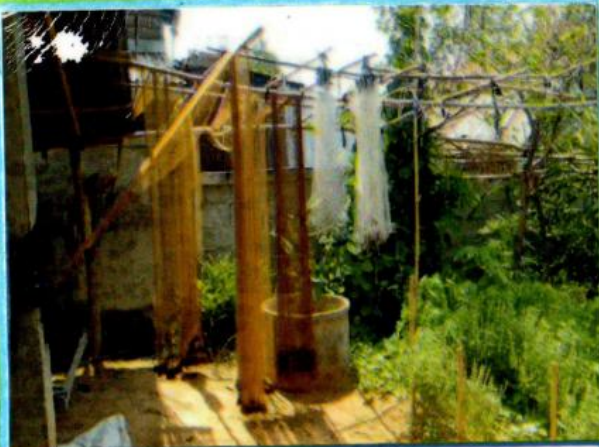
การสานเครื่องมือจับสัตว์น้ำ