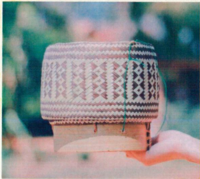
ลายไทยในกระซัง

ผ้าสุมาตราเดินเข้าไปหยิบกระติบข้าวในบ้านมาให้เจ้ไปตุกที่ละคัน