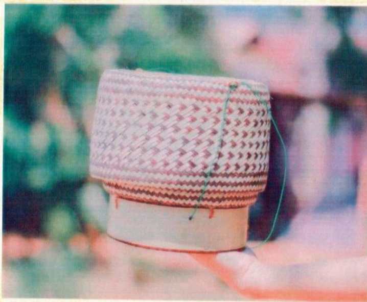
ลายหัวใจ