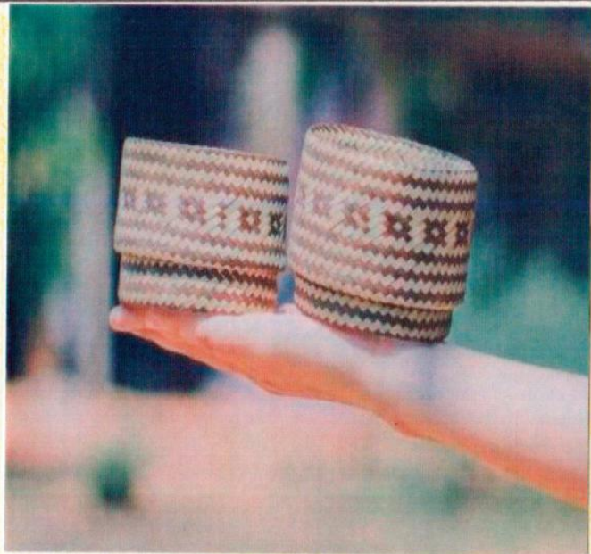
ลายดอกผักแว่น