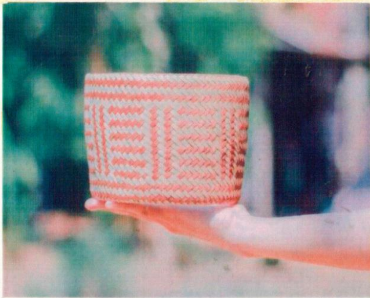
ลายข้างกระเต