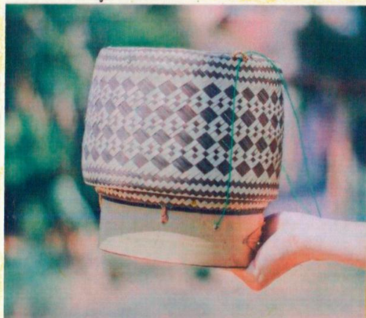
ลายไข่เมงดา