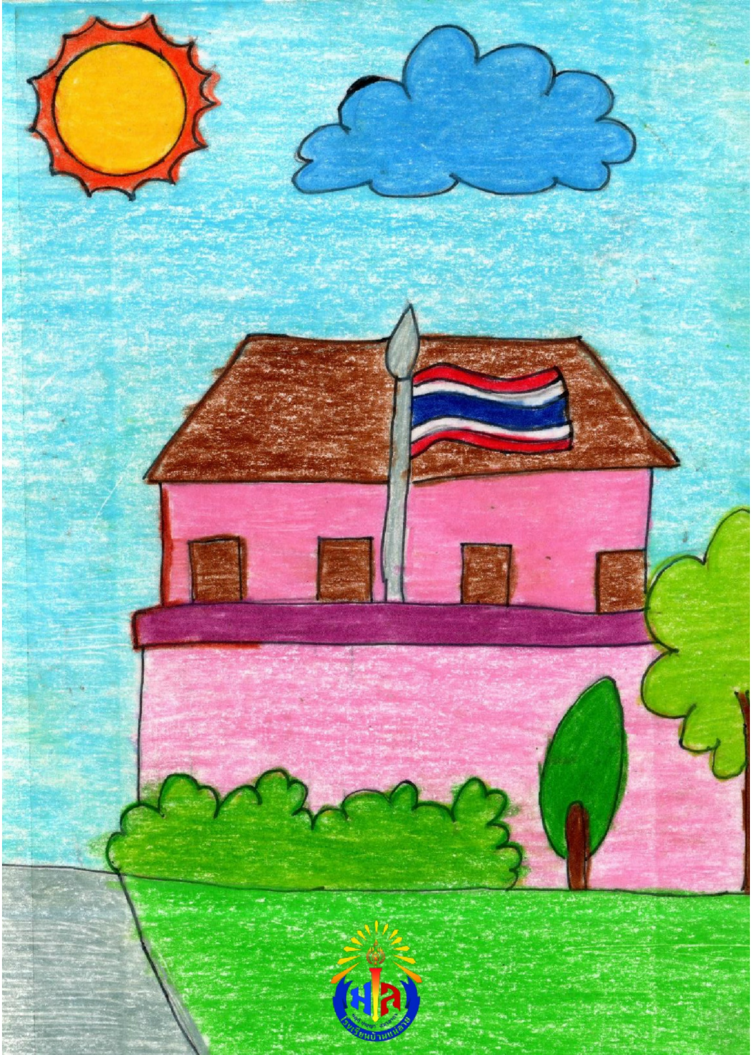
หนังสือเล่มเล็กทำมือ นิทานจากโคลงโลกนิติ ชั้น ป.๕ โรงเรียนบ้านแม่ลาย อ.ฮอด จ. เชียงใหม่ สพป.เชียงใหม่ เขต ๕