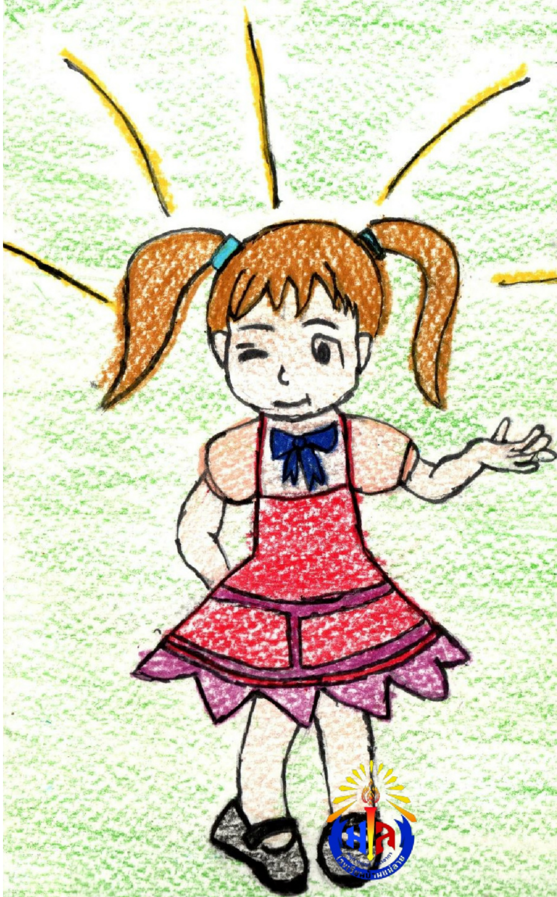
หนังสือเล่มเล็กทำมือ นิทานจากโคลงโลกนิติ ชั้น ป.๕ โรงเรียนบ้านแม่ลาย อ.ฮอด จ. เชียงใหม่ สพป.เชียงใหม่ เขต ๕