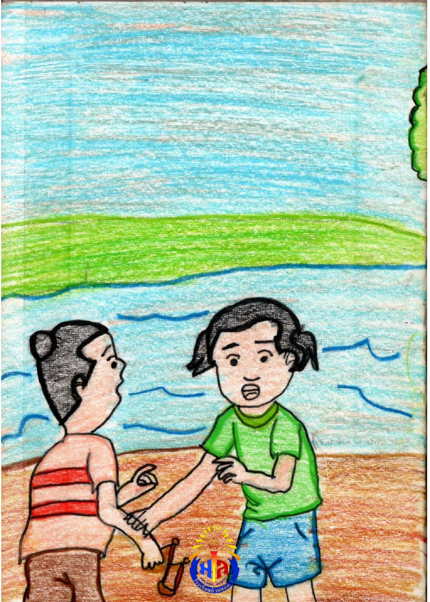
หนังสือเล่มเล็กทำมือ นิทานจากโคลงโลกนิติ ชั้น ป.๕ โรงเรียนบ้านแม่ลาย อ.ฮอด จ. เชียงใหม่ สพป.เชียงใหม่ เขต ๕