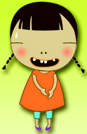
แต่หนูนิด ฟันหลอ

เมื่อถึงวันประกวดหนูน้อยยิ้มสวย เด็ก ๆ ทุกคนต่างอวดยิ้มเต็มที่ หนูนิด หนูน้อย หนูโก้ หนูแจ้ว ยิ้มสวยเพราะฝึกยิ้มทุกวัน