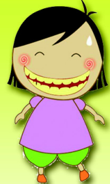
หนูแจ้ว ฟันเหลือง