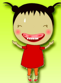
หนูโก้ เขื่อกบวม