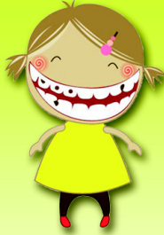
หนูน้อย ฟันผุ