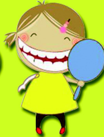
หนูหน้อย